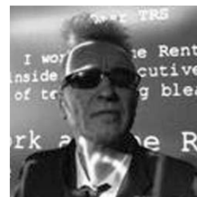
REVOLUTIONARY SONG Istvan Kantor Experimentalfilm 9 Min Kanada 2005

Ein Abend auf dem Rummelplatz. Ein Latino Vampir verliebt sich Hals über Kopf. Wie kann er die junge Dame umgarnen, die ihn zurückweist und vor ihm flieht? Zeit für ein Tänzchen! Eine seltsam schöne Synthese aus schwungvoller Choreografie und technischem Ideenreichtum.