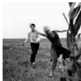
AÏE Virginie Gourmel Spielfilm 11 min Frankreich/Belgien 2007

Der Film zeigt eine Auswahl vieler kleiner Dinge, mit denen verschiedene Leute versuchen, ihr Leben lebenswerter zu machen.