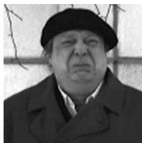
LIVE WORTH LIVING Jyrki Väisänen/Eirik Svensson Spielfilm 12 min Finnland 2007

Im Jahr 2002 gründete eine Gruppe von Studenten der Schule für Populäre Musik in Avellaneda, einem Arbeiterviertel von Buenos Aires, das Orquesta Tipica Fernandez Fierro. Das war die erste Neugründung eines Tango-Orchesters seit Jahrzehnten aus Mangel an Spielorten eroberten sie damit die Strassen von Buenos Aires. Orquesta Tipica bezeichnet die Tangoorchester, die sich zwischen 1915 und 1920 in Argentinien und Uruguay zu entwickeln begannen.