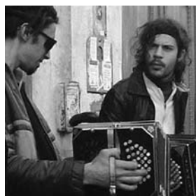
ORQUESTA TIPICA Nicola Entel Dokumentarfilm 20 min Argentinien 2007

Milan erzählt die Geschichte zweier Brüder während der NATO-Bombardierungen Jugoslawiens. Milan findet im Wald einen verletzten amerikanischen Bomberpiloten. Sein älterer Bruder hat zur gleichen Zeit einen Busunfall, kommt auf die Intensivstation und stirbt, weil nach einem Luftangriff der Strom ausfällt. Erst dieses Ereignis macht Milan und den anderen das Ausmass des Krieges bewusst. Der Film zeigt die Absurdität des Krieges – eines jeden Krieges – parabelhaft wie realistisch und wirft in komprimierter Form Sinn- und Schuldfragen auf.