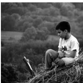
MILAN Michaela Kezele Spielfilm 22 min Deutschland/Serbien 2007

Und wieder geht's in die nächste Saison von Kurz und Knapp mit dem Block 3 des internationalen Wettbewerbs 2007 der Internationalen Kurzfilmtage Winterthur. Die Kurzfilmtage zeigen seit 11 Jahren ein breites Spektrum an Kurzfilmen, ohne Berührungsängste und mit Pioniergeist. Alle Genres sind vertreten und spiegeln das aktuelle Schaffen des Kurzfilmes. Der Block 3 beinhaltet all diese Punkte und deshalb zeigen wir den gesamten Block. Es ist zwar kein Gewinner dabei, aber trotzdem voller Perlen, die auch einen Preis verdient hätten. K&K Prädikat: «Einer der besten Filmblöcke die wir an einem Filmfestival gesehen haben». Herzlichen Dank an die Kurzfilmtage.