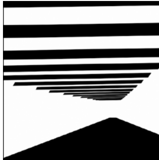
ÜBERGÄNGE Schweiz 2007 2 Min. von Sarah Villiger

Ein wunderschöner Sonntag, Picknick im Park und der Geburtstag des Sohnes - aber warum genau am Tag des entscheidenden Celta-Spiels?! Zwei Männer am Rande des Nervenzusammenbruchs, sobald die Liebe zum Verein und die Hoffnung auf einen hohen Geldgewinn aufeinanderprallen. Eine wunderbare Fußballgeschichte - auch jenen zu empfehlen, die mit dem Sport eigentlich nichts anfangen können.