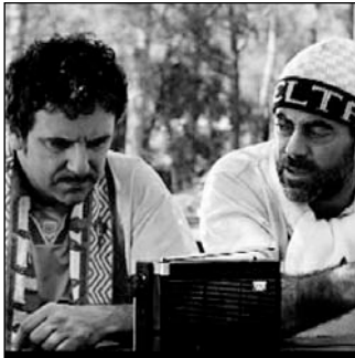
TEMPORADA 92-93 (SEASON 92-93) Spanien 2006 11 Min., span. OmeU Regie, Drehbuch: Alejandro Marzoa Kamera: Victor Rius

Fredy hat den Seitensprung hinter sich, dem Kaktus auf dem Balkonsims steht er noch bevor.