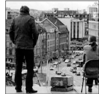
AUF DER STRECKE Schweiz/Deutschland 2007 30 Min. Regie: Reto Caffi