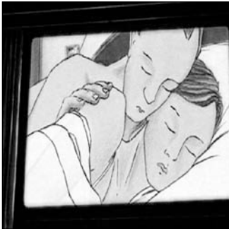
NOT THE END Schweiz 2007 10 Min. von Clemens Steiger

TAPTAB SCHAFFHAUSEN • DO. 20.11.08 • 20.30 UHR BEGINN KUGL ST. GALLEN • DO. 04.12.08 • 20.30 UHR BEGINN SALZHAUS WINTERTHUR • DO. 04.12.08 • 20 UHR BEGINN