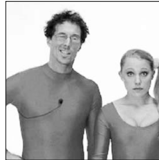
ANIMANTRONIC - THE WINSTON EFFECT Österreich 2007 9 Min., engl. OF Regie, Schnitt: Andreas Schmied Kamera: Matthias Leonhard

Der Übergang vom Leben in den Tod in Form einer Zugfahrt.